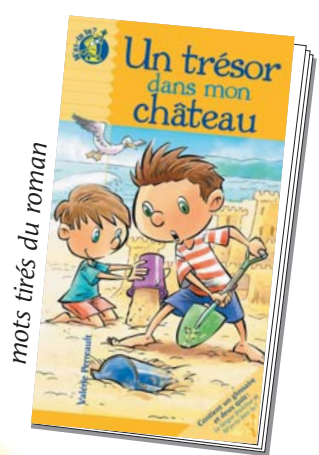
mots tirés du roman

Solution : 1. pirate 2. navire 3. éclaireur 4. tous 5. équipe 6. creuser 7. riche 8. erreur 9. migre 10. espionner 11. épées 12. festin 13. diversion 14. voler 15. amarré 16. poisson 17. robuste 18. rubis